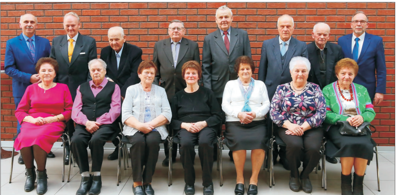
Pary 60 i 65-lecia pożycia małżeńskiego.