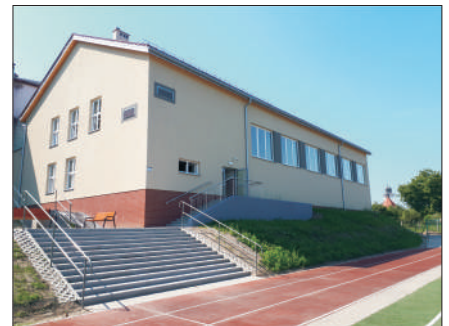
Sala w Szkole Podstawowej w Sośnicowicach.

wy, co pozwoliło udostępnić pacjentom I piętro ww. budynku, oferując pomoc medyczną w kilkunastu poradniach.