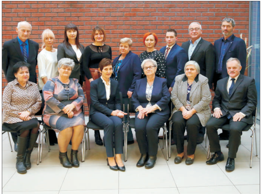
Radni Rady Miejskiej w Sośnicowicach.