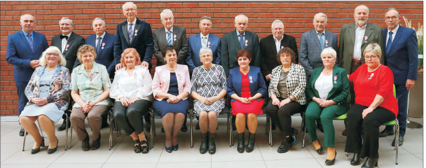
Pary 50-lecia pożycia małżeńskiego.