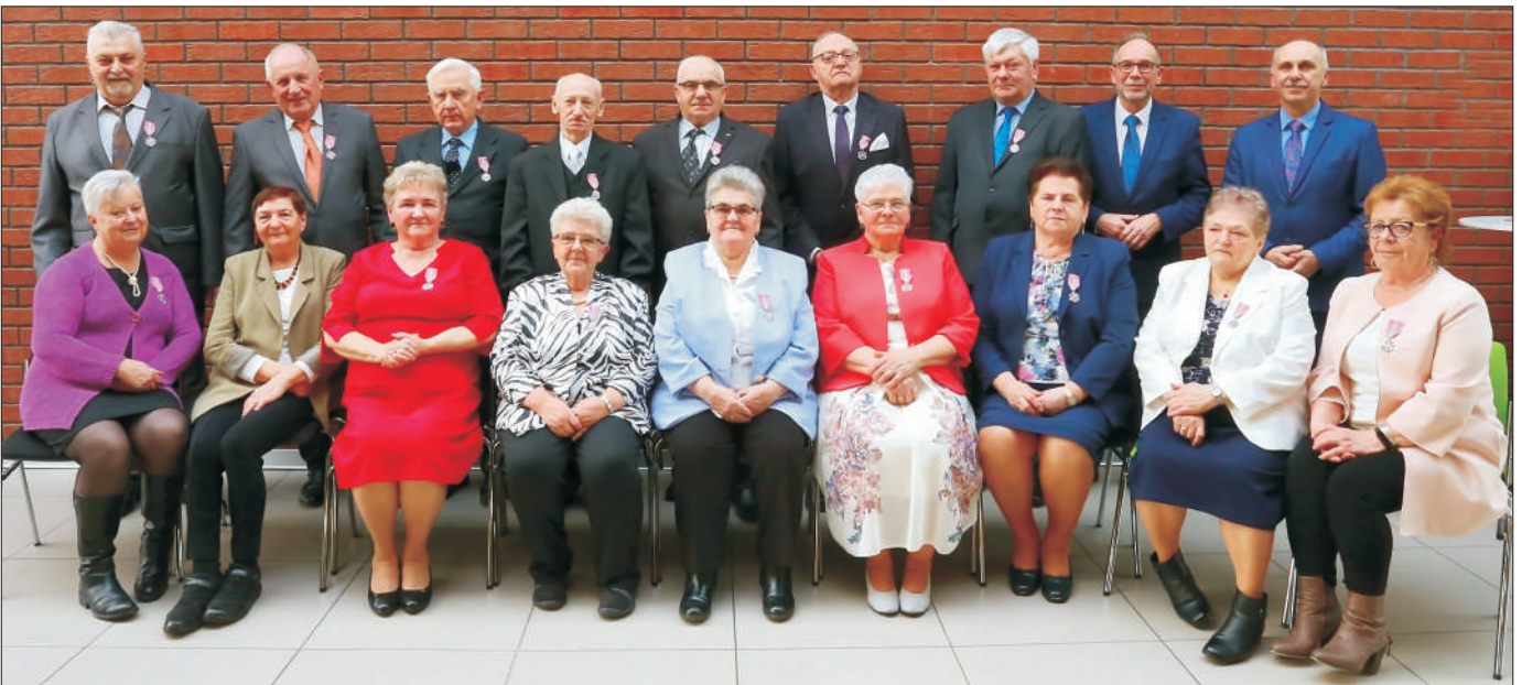
Pary 50-lecia pożycia małżeńskiego.