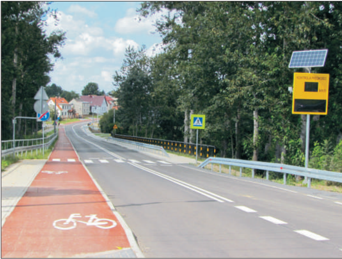
Droga w Smolnicy.